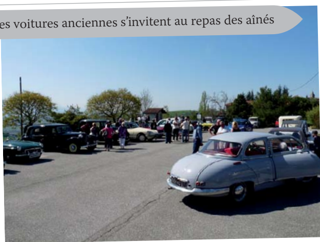
des voitures anciennes s'invitent au repas des aînés