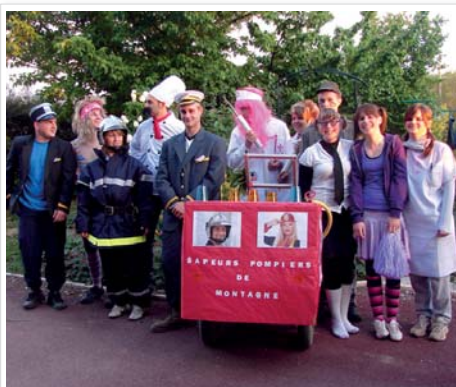
2011, Montagne en images p 30 entre nous