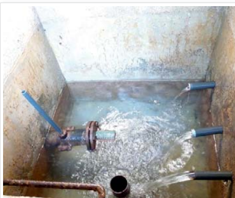
eau potable, interconnexion en vue p 8 vie municipale