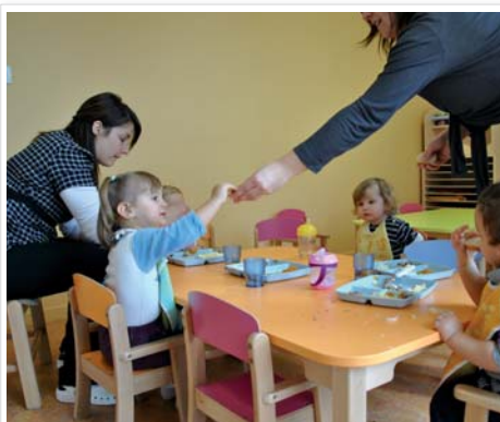
ouverture du multi accueil p 19 vie intercommunale