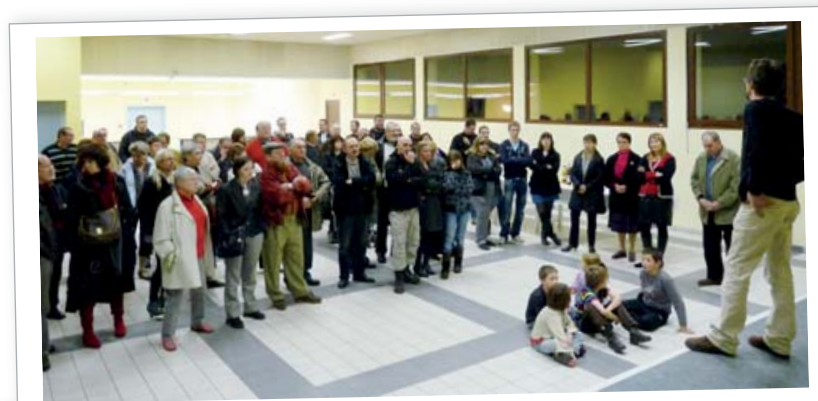
vœux du conseil municipal