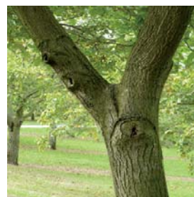
un Y aperçu dans un noyer