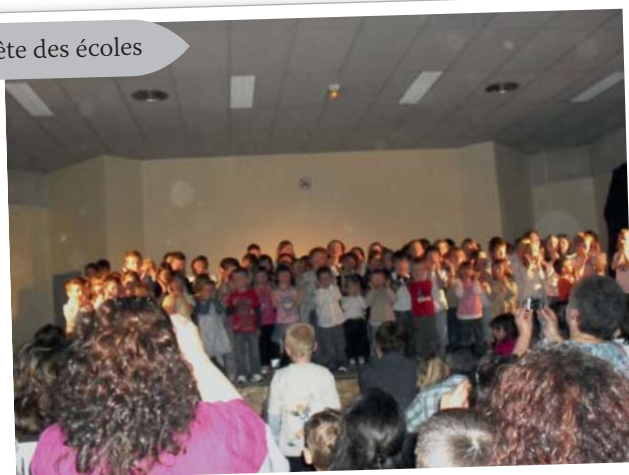
fête des écoles