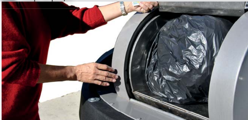
ordures ménagères : passage à la redevance incitative p 3