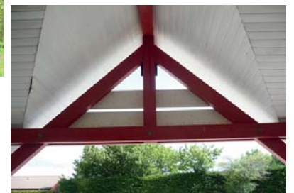
le A nous abrite à l'école