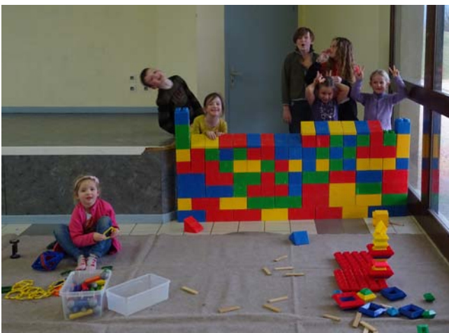
La ludothèque à Montagne (8 mars 2019)