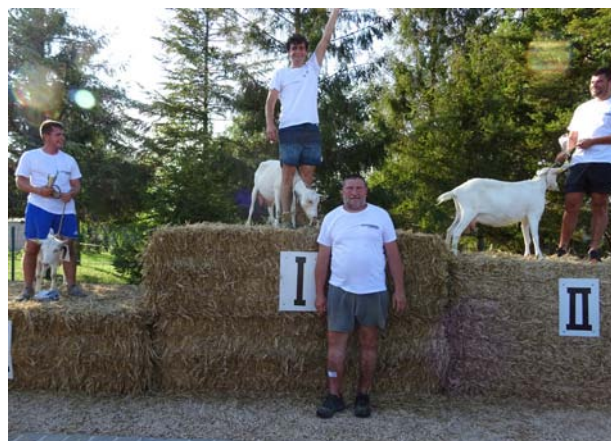
Les gagnants du tiercé aux chèvres 2019