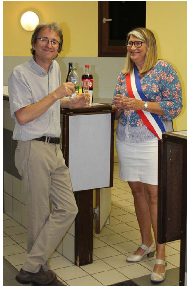
La passation de pouvoir.