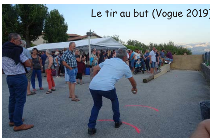
Le tir au but (Vogue 2019)