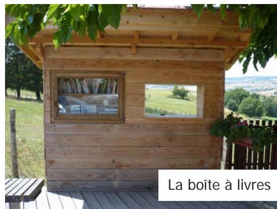
La boîte à livres