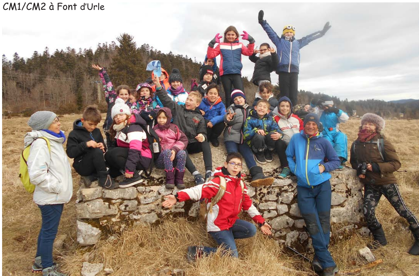
La classe découverte CM1/CM2 à Font d'Urle