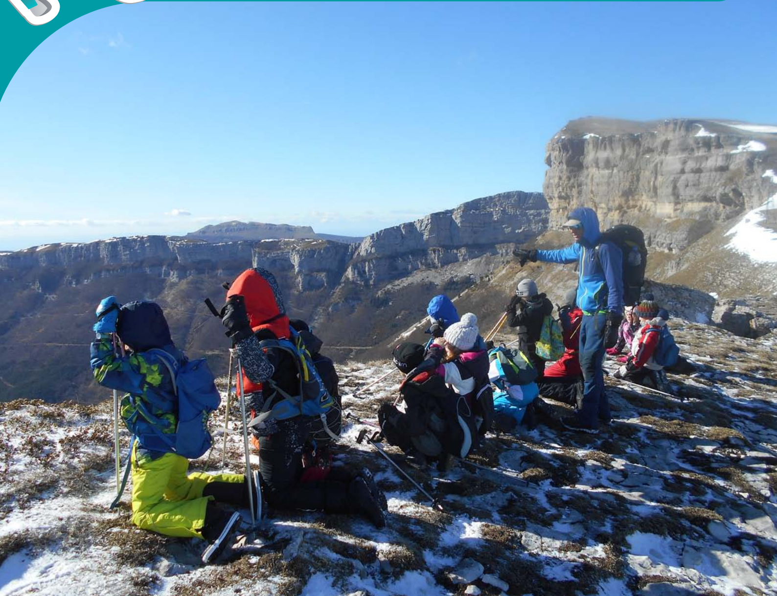
La classe découverte CM1/CM2 à Font d'Urle

BULLETIN COMMUNAL D'INFORMATION DE MONTAGNE | N°24 | JUILLET 2020