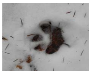
Sur les traces du loup (classe CM1/CM2)