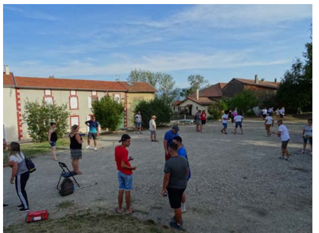
Concours de boules (Vogue 2019)