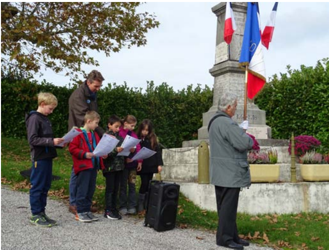
Les élèves de l'École du Lendemain lisent un poème de Paul Éluart (11 nov. 2019)