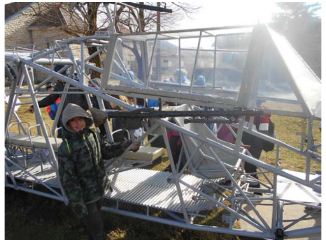
Les planeurs Allemands à Vassieux (classe découverte CM1/CM2)