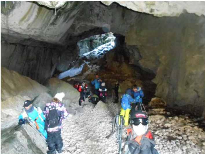
La glacière de Font d'Urle (classe découverte CM1/CM2)